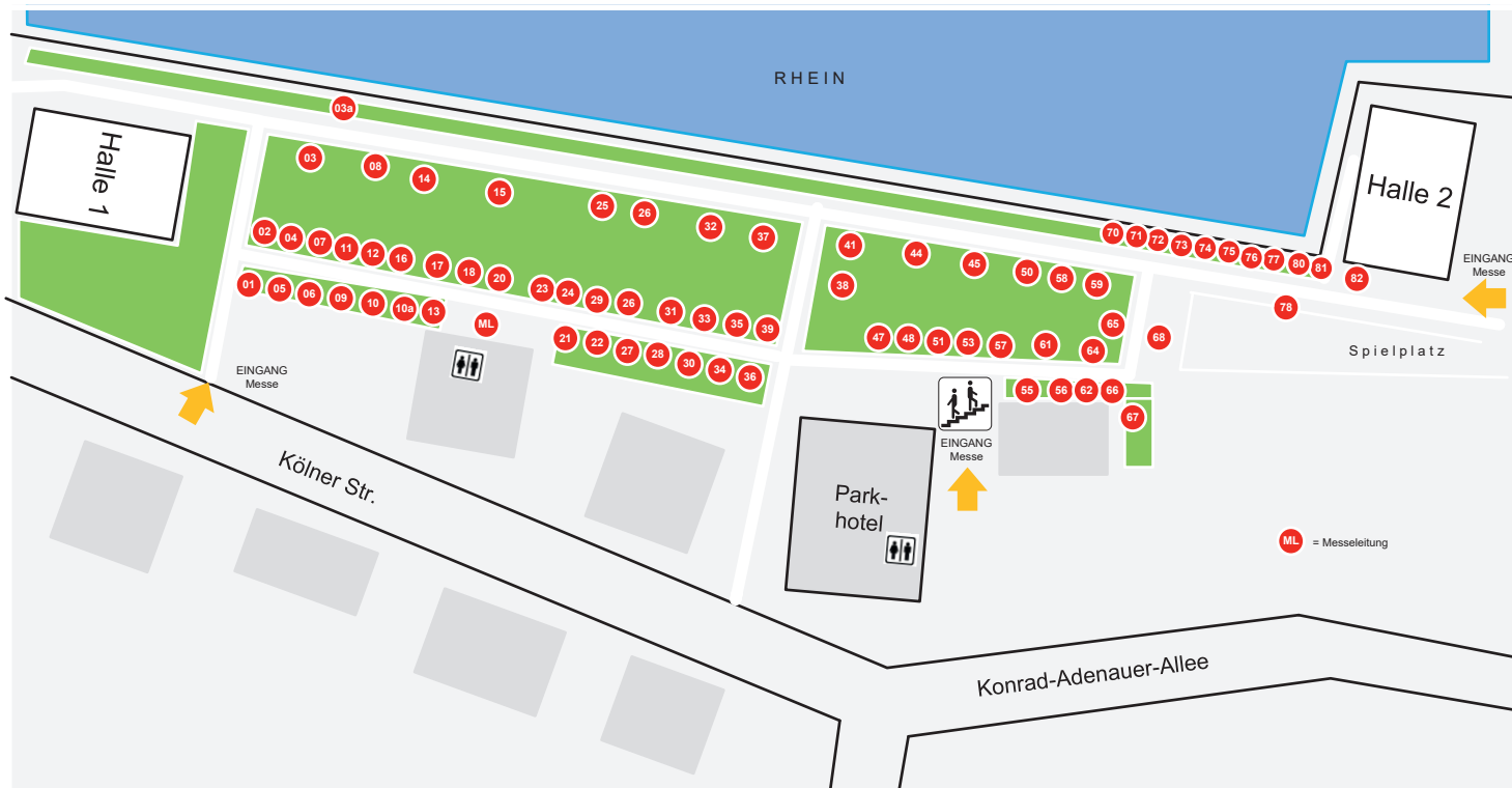
Halle 1 „Alter Kranen“

Infos 0261 9839930 | www.messeandernach.de